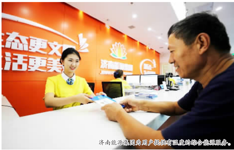
济南能源集团为用户提供有温度的综合能源服务。

百姓冷暖记心间,能源保供冲在前。在即将到来的2021-2022年采暖季,济南能源集团将充分发挥“一张网”整合优势,积极践行“知行合一,为人民服务”企业核心价值观,坚决打赢双气保供战役,推进清洁取暖,确保百姓温暖过冬,以服务提升永无止境的态度全力打造全国一流综合能源服务企业,切实履行“为生更文明,让生活更美好”的企业使命,向政府和全市人民交上一份“天蓝冬暖”的能源答卷。(本报记者 鲁婧)